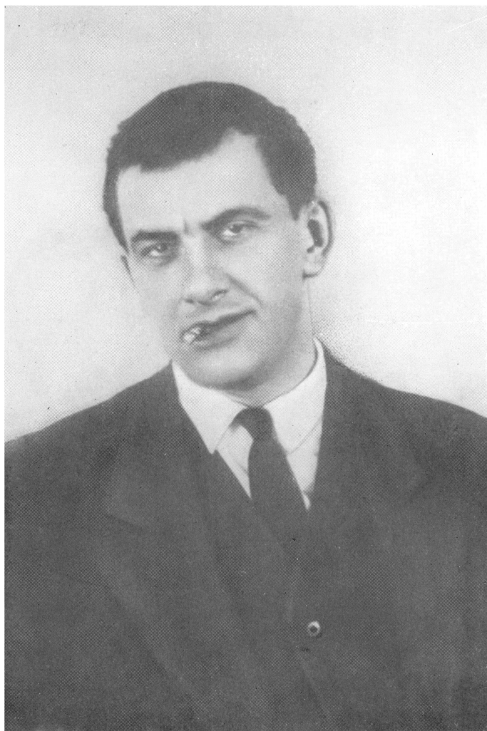
В. МАЯКОВСКИЙ. Фото. 1929 г.