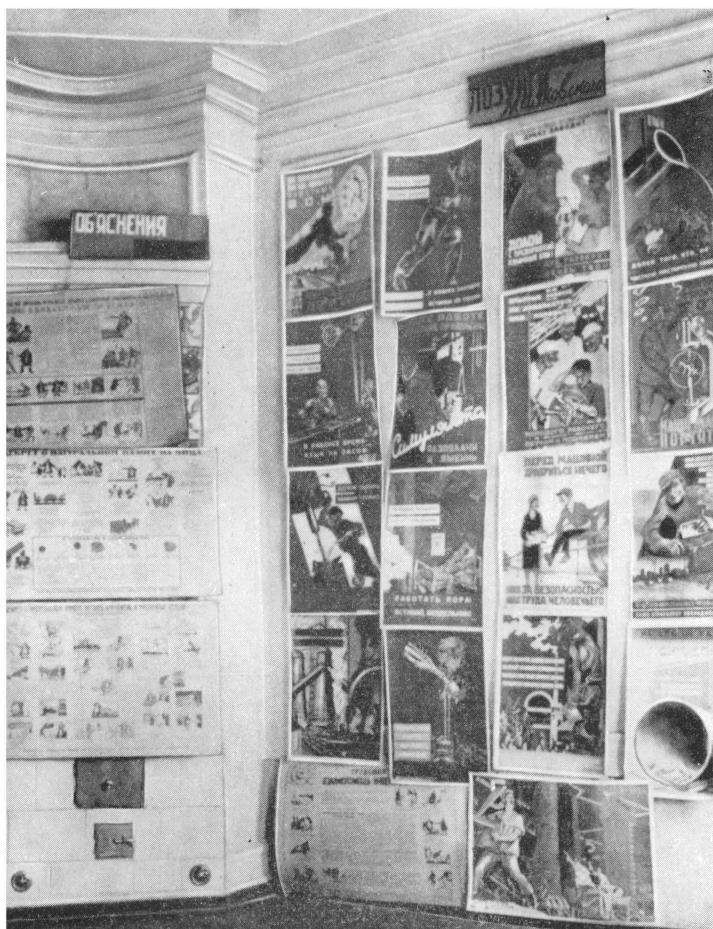
Стенд выставки «20 лет работы Маяковского».