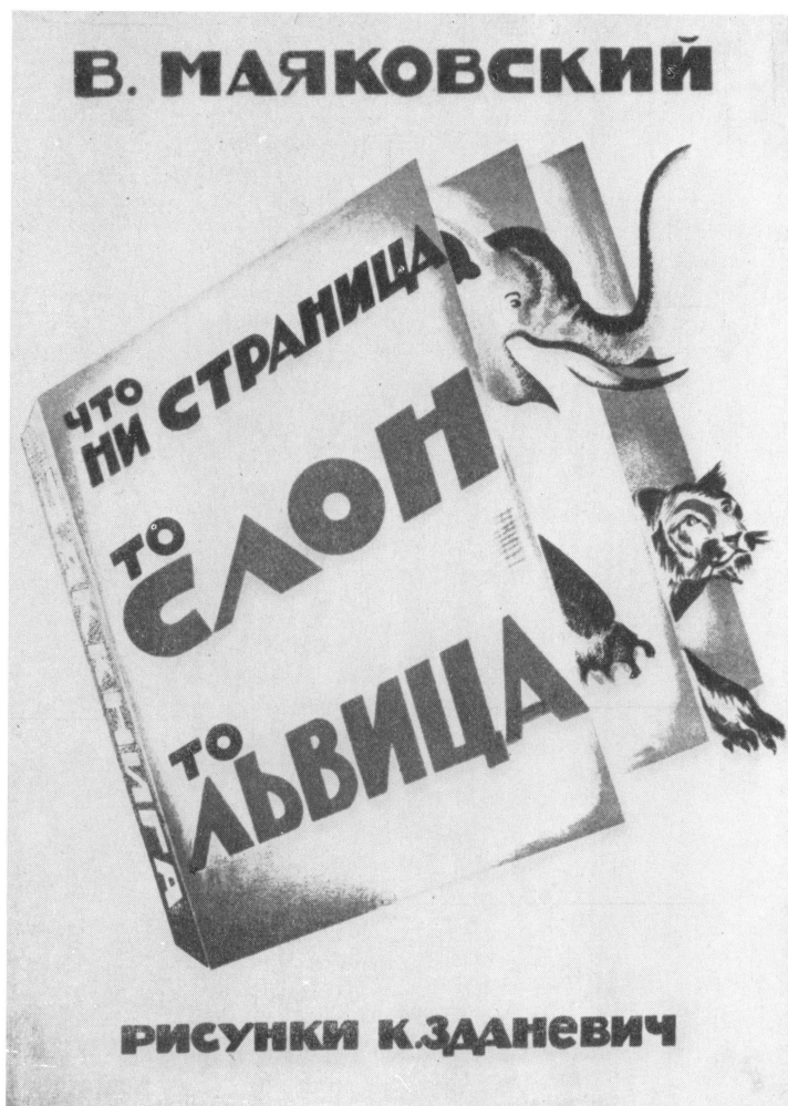
Обложка книжки для детей «Что ни страница,— то слон, то львица».