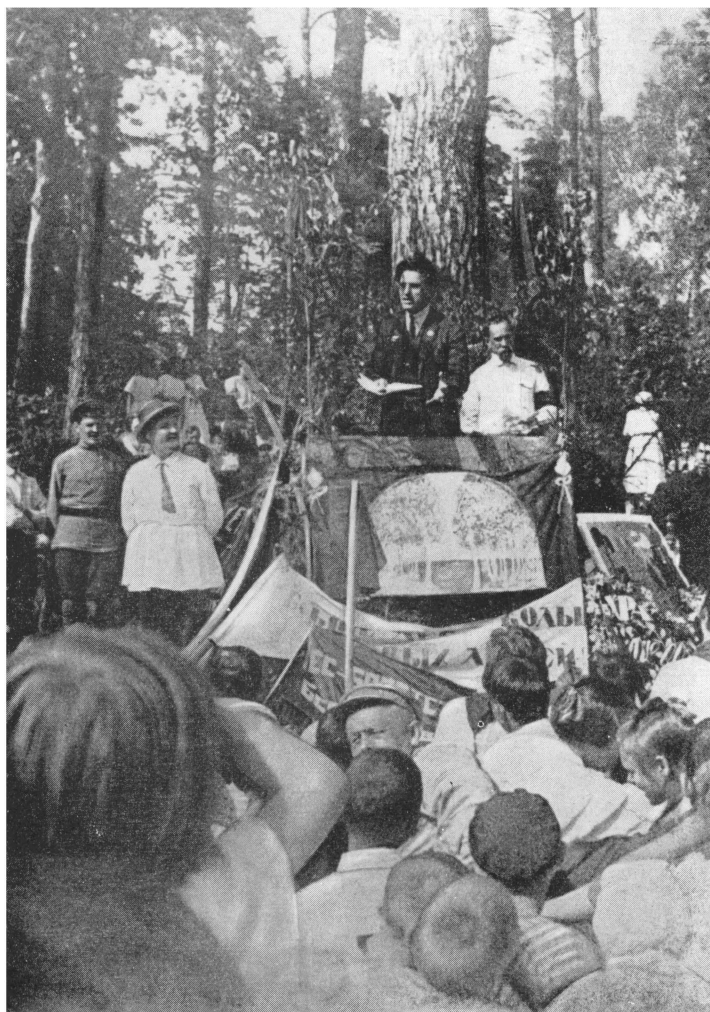
Выступление Маяковского перед школьниками в Сокольниках 10 мая 1925 г.