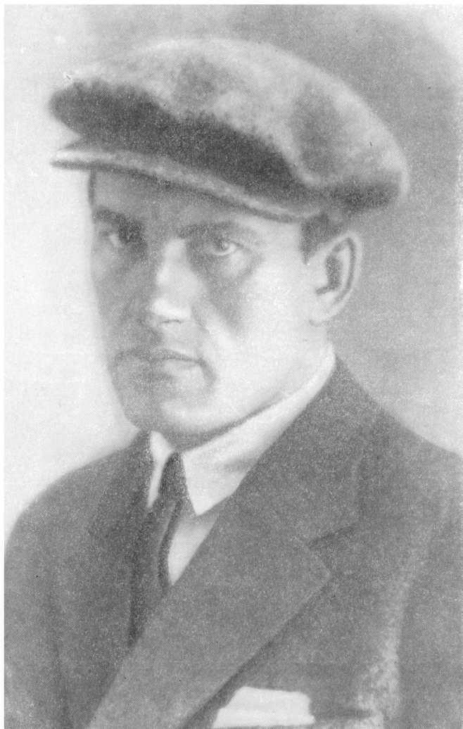
В. МАЯКОВСКИЙ Фото. 1929 г.