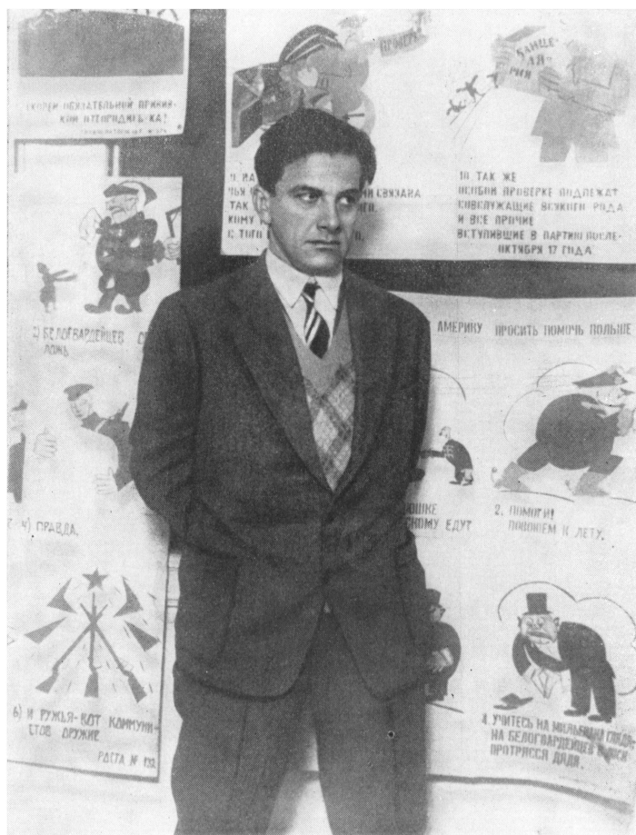
В. Маяковский на выставке «20 лет работы Маяковского».